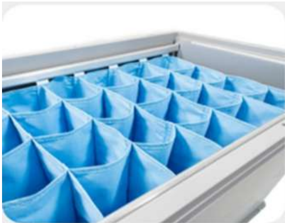
AMÉNAGEMENT BOX PLASTIQUE AVEC TEXTILE